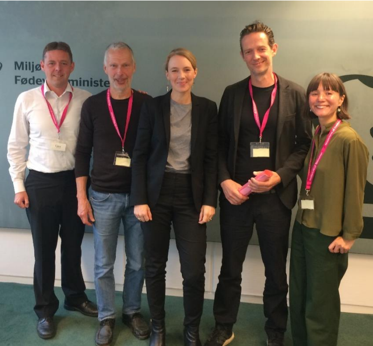
▲ Rådet for Grøn Omstilling mødtes med miljøminister Lea Wermelin (S) for at snakke luftforurening, landbrugspolitik, plastik og cirkulær økonomi.